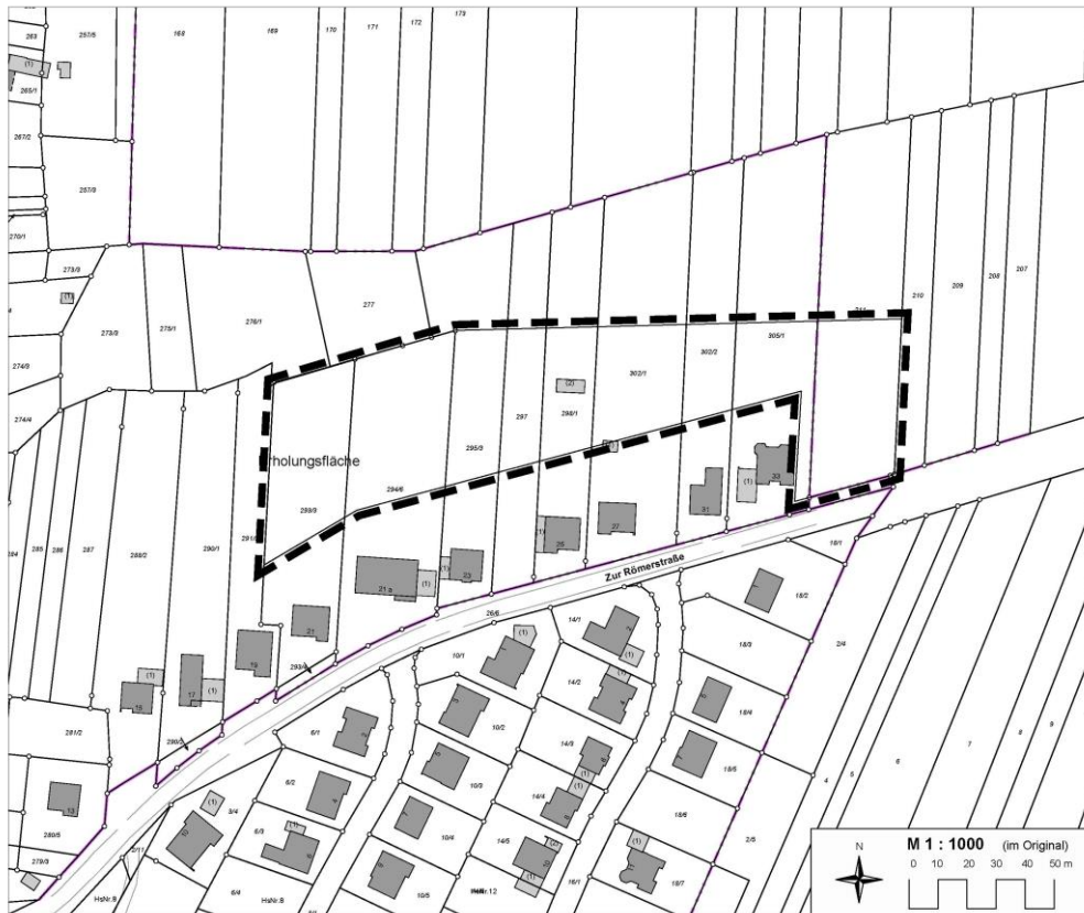
Geltungsbereich des Bebauungsplanes, ohne Maßstab, genordet